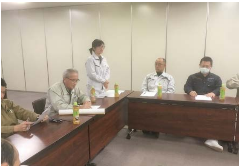
新規入会「東輝工業(株)」