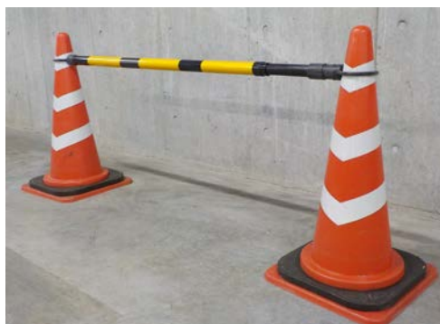
カラーコーンとコーンバー