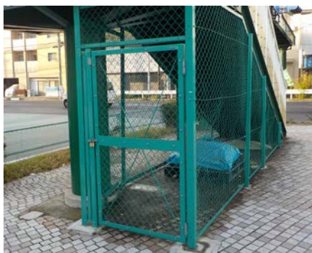
緊急輸送路沿道の資材置場

横浜市では災害応急対策に必要な物資、資機材、要員等を輸送する緊急車両が通行する道路を「緊急輸送路」として指定しています。一般社団法人横浜建設業協会と横浜市は災害時の協力要請と応急活動について協定を結んでいます。特に、市内に震度 5 強以上の地震が発生した場合は、初期活動として本市からの協力要請を待たずして、各区会員が緊急巡回及び応急措置等を行うこととしています。