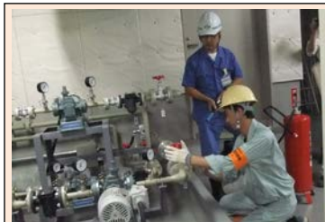
※昨年度実施された訓練の様子 出動者が被害想定箇所の安全点検を行いました。

建築・電気設備・機械設備の各業種が一体となって出動班を編成するため、応急措置にあたって連携を図ることができます