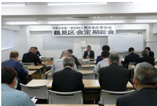
鶴見区会 定期総会開催状況