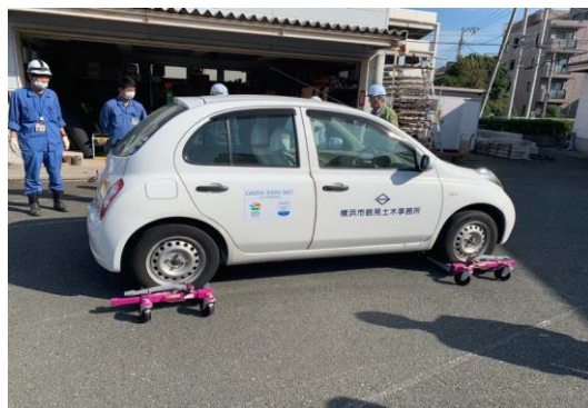
行動シミュレーション訓練 車両移動訓練