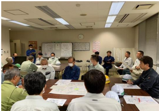
訓練についての説明

日時 令和5年11月9日（木） 8：45～11：30 場所 鶴見土木事務所2階会議室 及び 各割当路線 実施内容 ・災害協定について説明 ・震災マップの配付並びに、各班の割当路線の確認説明 以下、「LINE」を使った ・緊急輸送路他巡回・点検及び情報受伝達訓練 ・状況付与による災害対応シュミレーション訓練 参加人数 鶴見土木事務所 所長、副所長、管理係長、道路係長、 管理係、道路係、下水道公園係職員 鶴見区会 22社26名