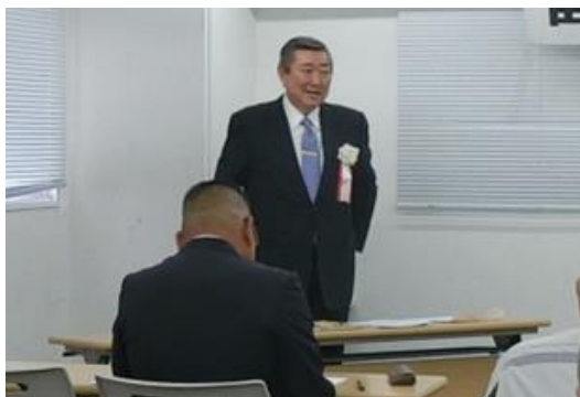
横浜建設業協会 山谷会長 祝辞