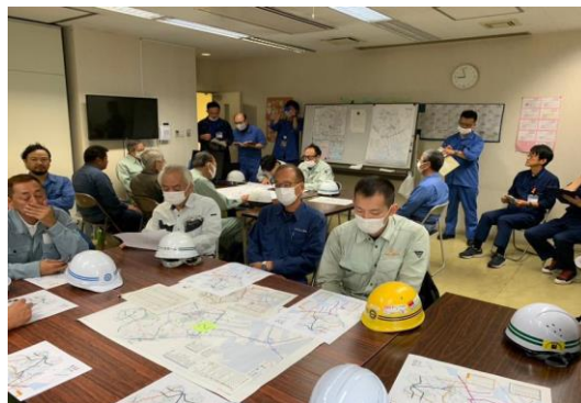
行動シミュレーション訓練 指示発信