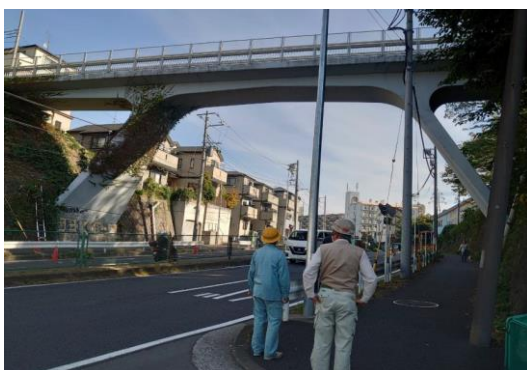
行動シミュレーション訓練 梶山陸橋確認