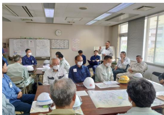
訓練終了後の講評