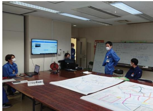
訓練終了後の講評