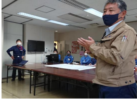
訓練についての説明