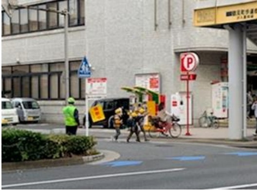
鶴見小学校 見守り活動

実施日 令和4年 5月10日 (火) ・汐入小学校 ・潮田小学校 及び 令和4年 6月10日 (金) ・市場小学校 ・平安小学校 実施場所 令和4年 7月 4日 (月) ・駒岡小学校 令和4年 7月11日 (月) ・生麦小学校 令和4年 9月12日 (月) ・岸谷小学校 ・上末吉小学校 令和4年10月11日 (火) ・寺尾小学校 ・東台小学校 令和4年11月10日 (木) ・鶴見小学校 令和4年11月16日 (水) ・豊岡小学校 実施内容 区内小学校のパトロール並びに通学路の安全点検の実施 参加人数 24社30名