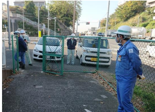
LINEを使った情報受伝達訓練