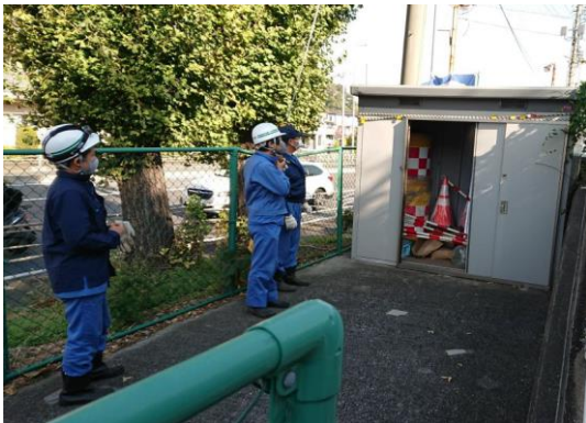
岸谷倉庫にて資機材確認訓練