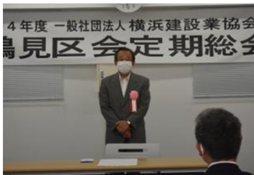
藤原様からの一言