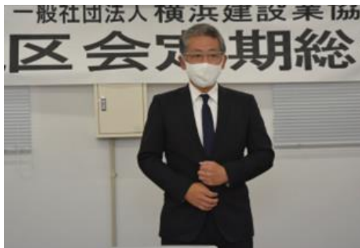
新鶴見区会長挨拶