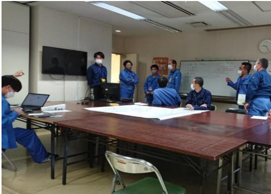
情報収集・指示発信訓練