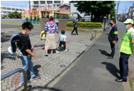
潮田小学校 見守り活動