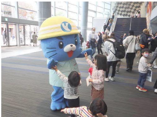
横浜アリーナ屋内会場