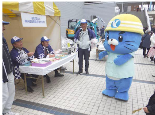
屋外 港北区会ブース