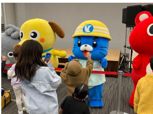
「ヨコアリくんまつり」出演