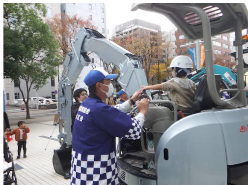
屋外 港北区会ブース