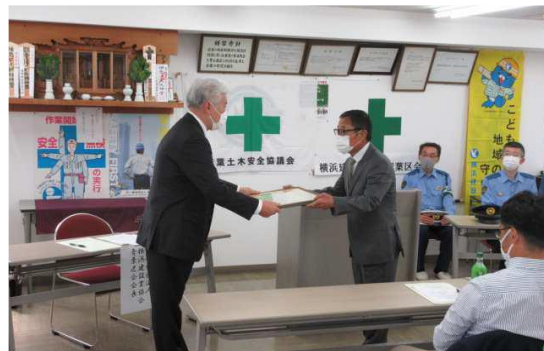
感謝状贈呈 山崎建設株式会社