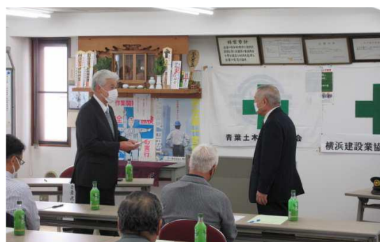
顕彰贈呈 日舗建設株式会社