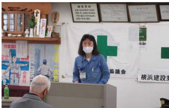
青葉土木事務所 所長挨拶