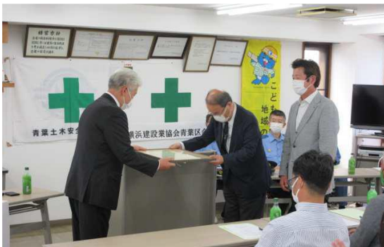
感謝状贈呈 金子工業株式会社