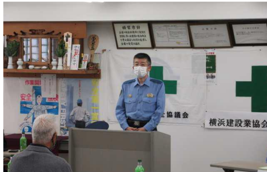
青葉警察 署長挨拶