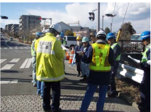
鉄町地内舗装補修工事 (株)紅梅組