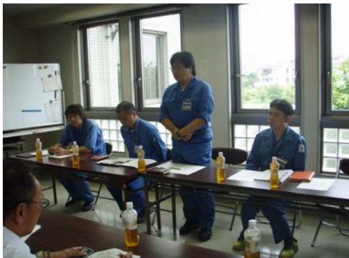
三ツ橋顧問あいさつ