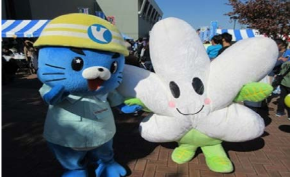
青葉区のマスコットなしかちゃんと横浜ケンジロー