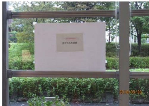
窓ガラス破損想定