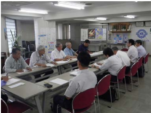
定例青葉区会 状況

日時 平成30年7月26日（木） 13時30分～ 場所 日舗建設(株) 3階 事業内容 理事会報告、安全パトロール報告、青色防犯パトロール報告 安全大会反省、その他 参加人員 11社12名