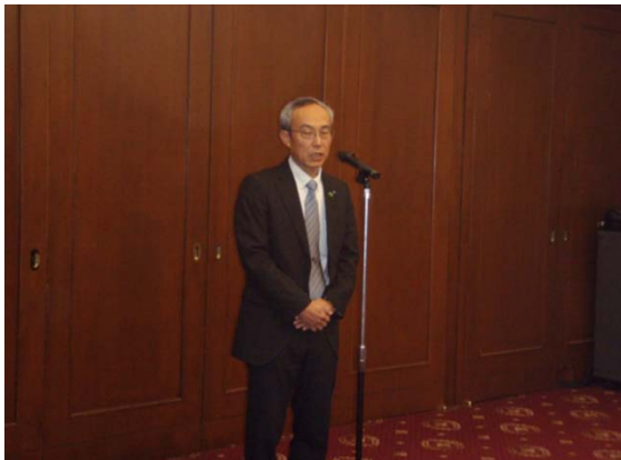
榎青葉土木事務所長 あいさつ