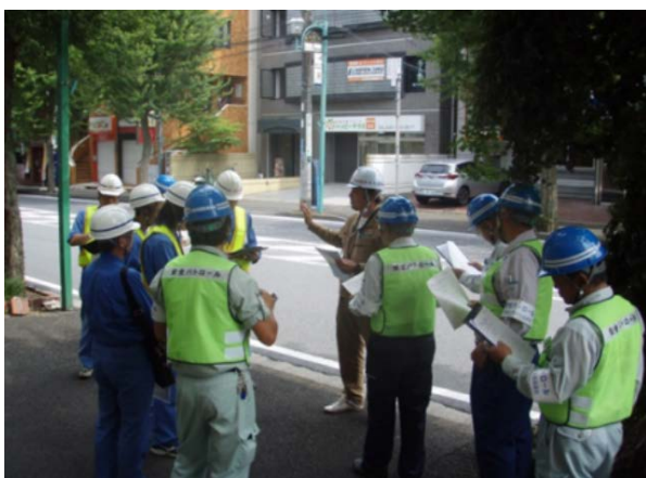
あざみ野一丁目舗装補修 (株)青武組) パトロール状況