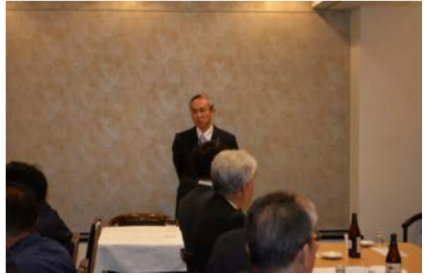
土木事務所あいさつ