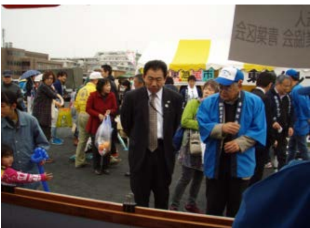
青葉警察署長に業界行事パネルの説明