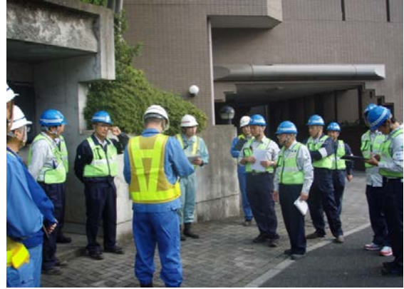
都筑処理区青葉台地区下水道整備工事（株水村建設）