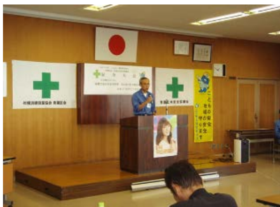
青葉土木所長あいさつ