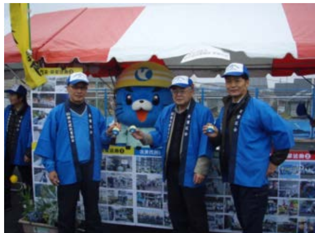
ケンジローマスコットと