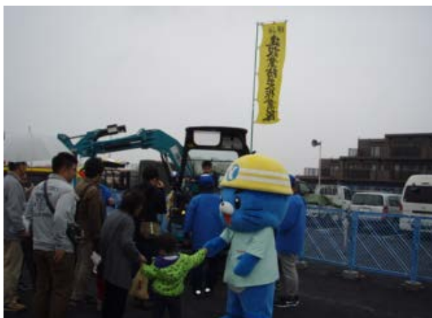
重機の乗降りのお手伝い