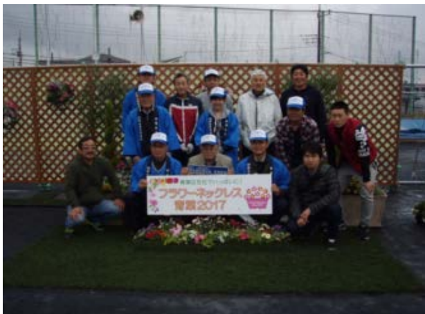
花壇作成パネルの記念写真