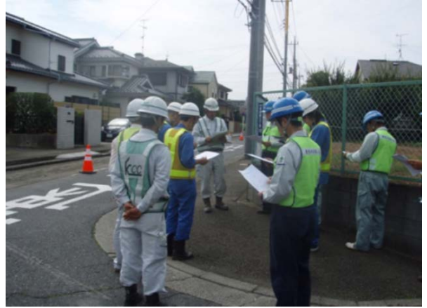
奈良川改修工事 都筑開発(株)