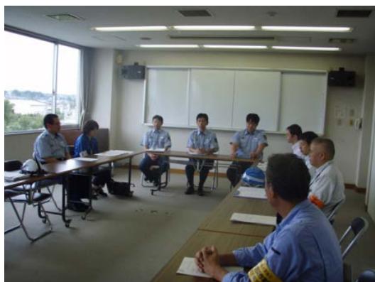
意見報告（消防署長）