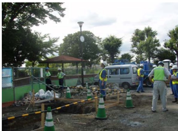
親和興業(株) パトロール状況