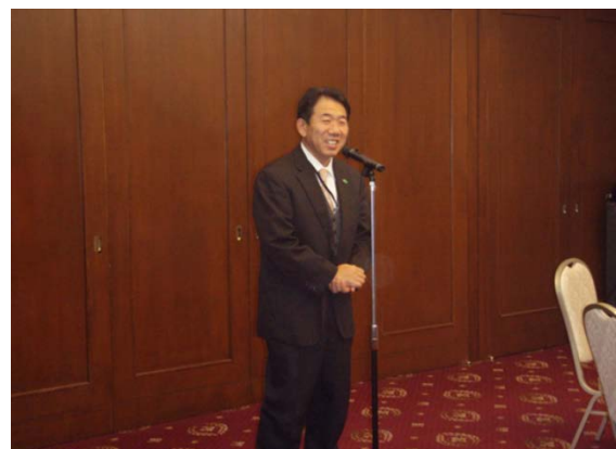
青葉警察署長のあいさつ