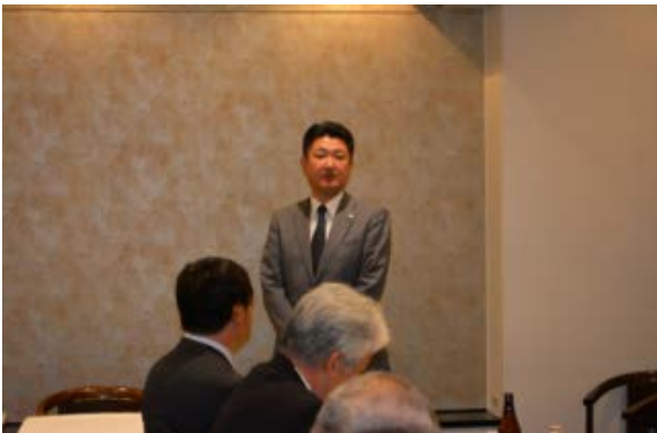
青葉警察署 交通課長あいさつ